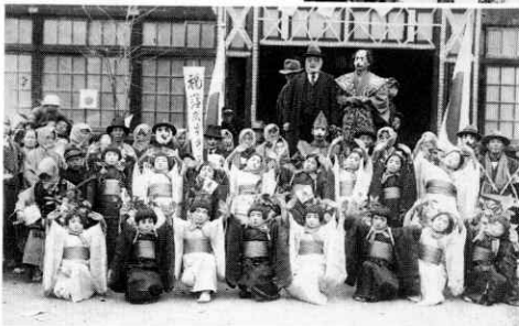
◀昭和9年 奉安殿と役場落成の祝賀行事 (仮装行列の一コマ)