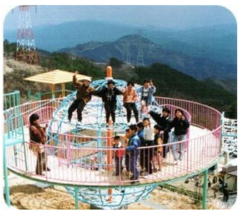
賑わっていた頃のなかよしパーク